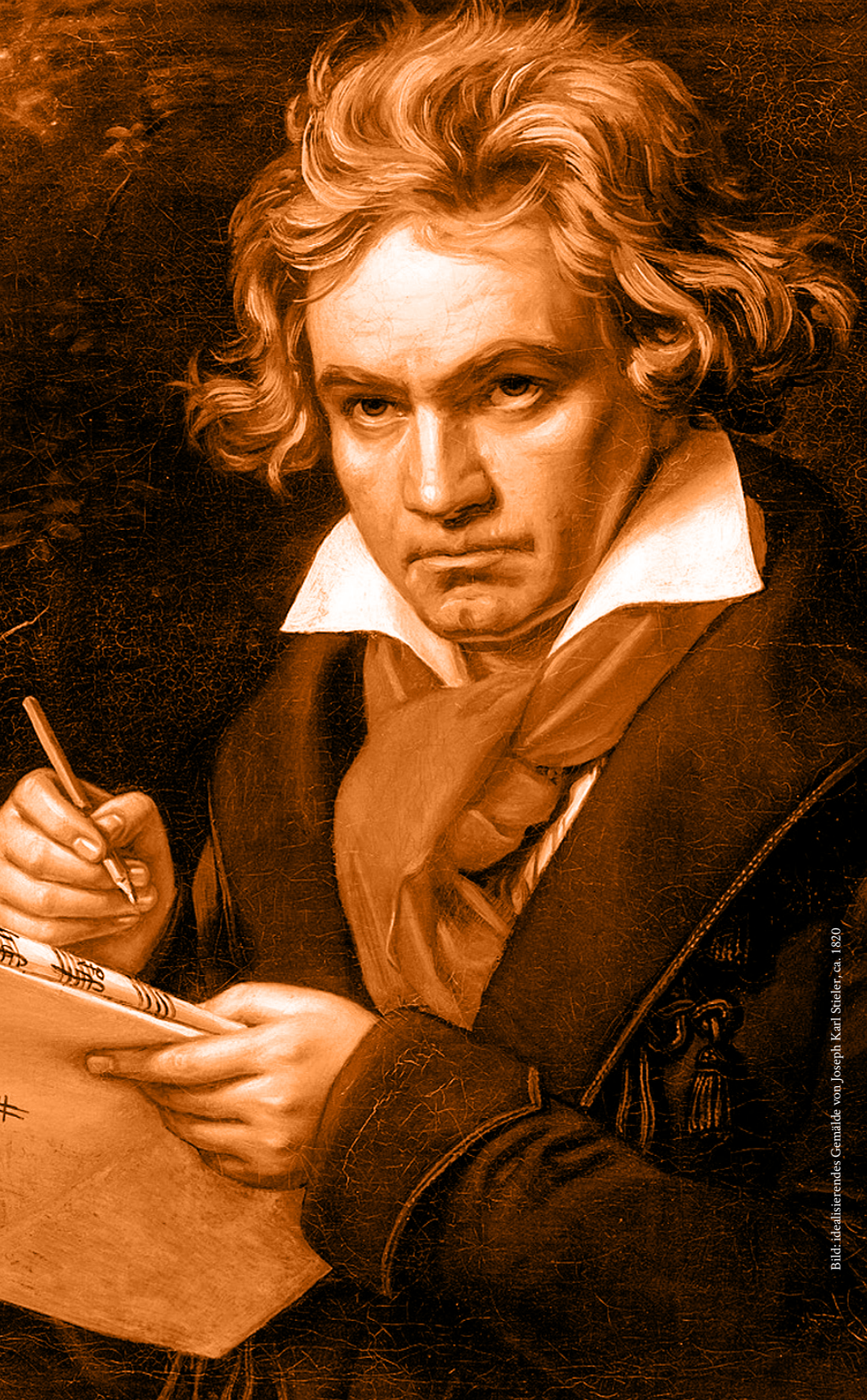
Bild: idealisierendes Gemälde von Joseph Karl Stieler, ca. 1820