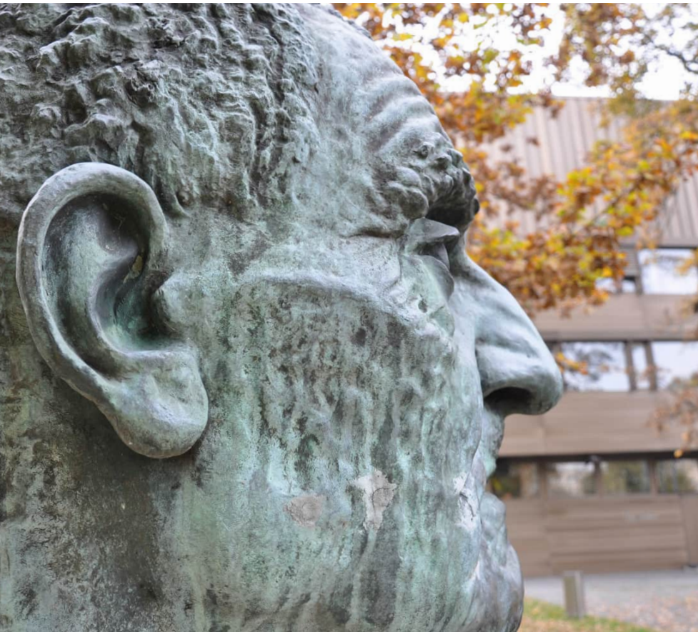
Brucknerkopf von Franz Strahammer beim Brucknerhaus in Linz