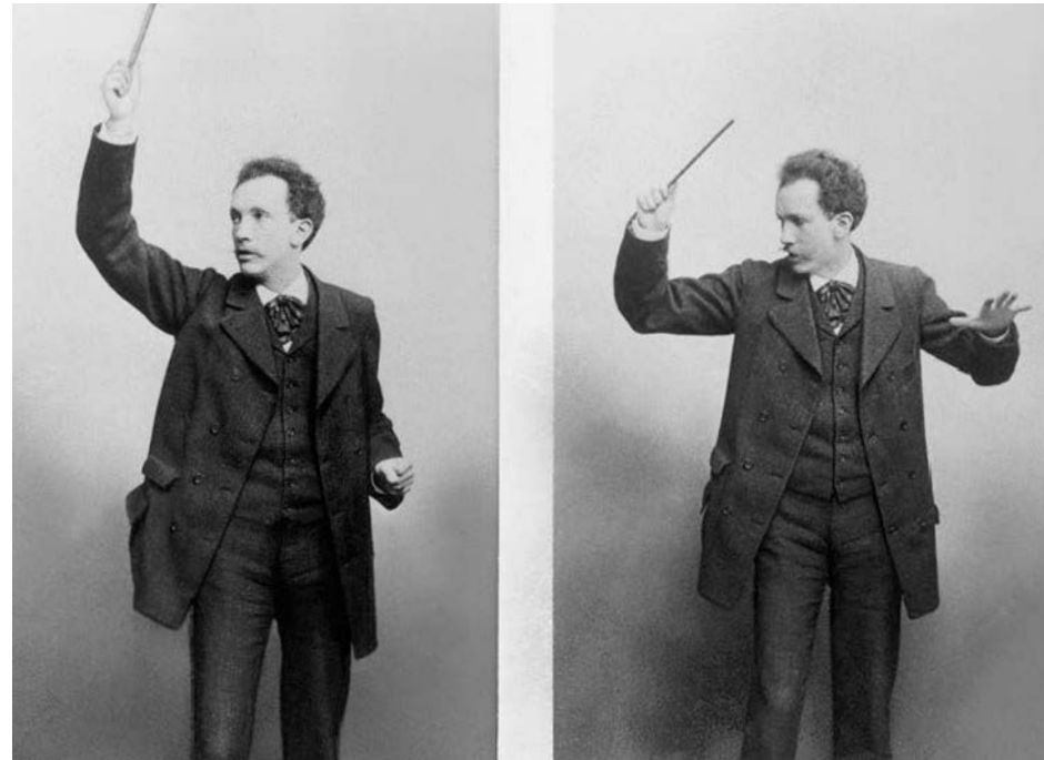
Strauss conducting